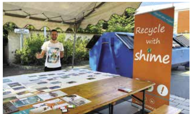
Stand Shime Les mégots et le développement durable au marché hebdomadaire