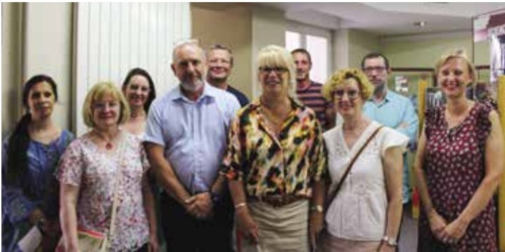
Inauguration de la Semaine de l'Environnement

À l'occasion de la Journée Mondiale de l'Environnement, la ville décide de s'engager, de sensibiliser et de faire comprendre les défis du développement durable à toutes les générations. Du 7 au 11 juin a eu lieu la première édition de la semaine de l'Environnement à Hagondange, avec au programme de nombreuses animations gratuites : conférence, exposition, ateliers enfant, balade et autres temps forts. Retour en images :