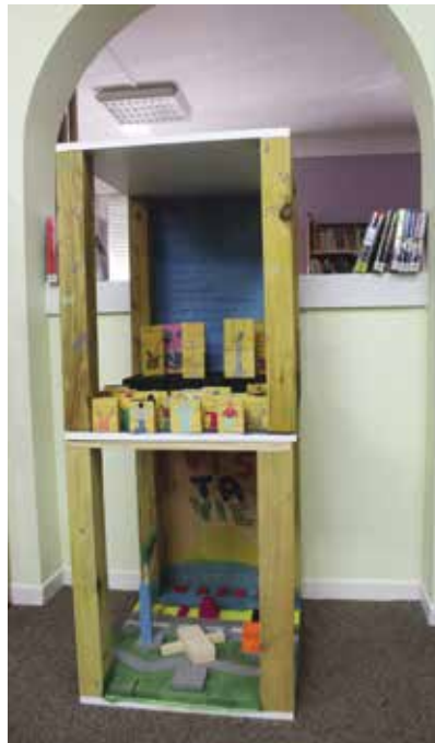
Exposition « Les artistes en bois »