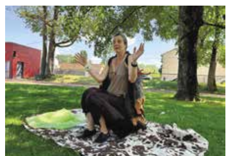
Conte Dame Chouette