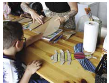
Atelier création de coccinelles et abeilles en carton