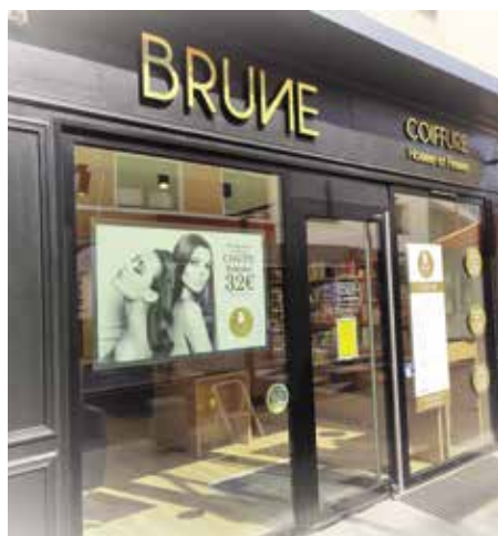
DANS L'ACTU Brune Coiffure