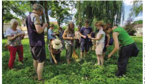
Balade découverte des plantes sauvages et médicinales