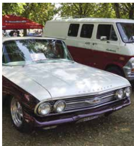
DANS L'ACTU Rêve Américain