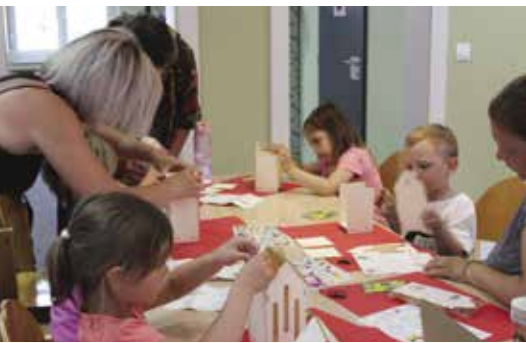
Atelier bricolage hôtel à papillons en bois