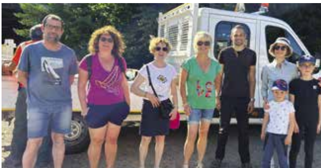
Opération ville propre